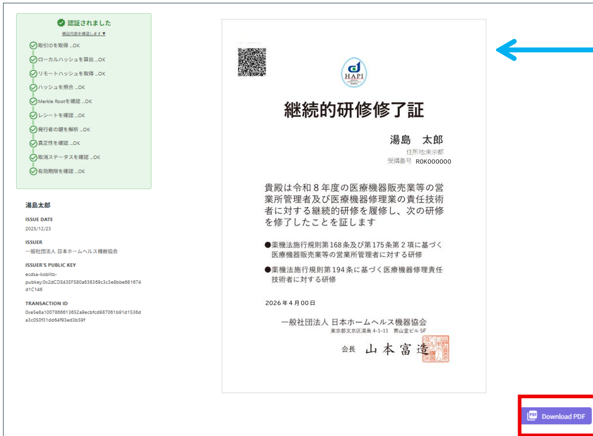
【A4 サイズ修了証 PDF（出力イメージ）】